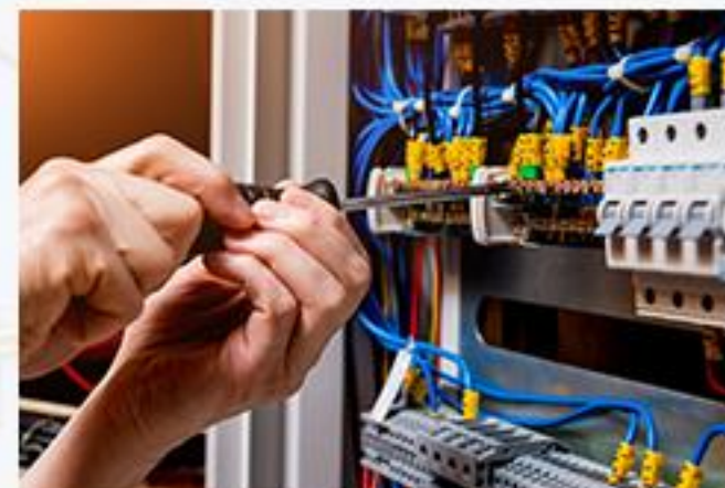
Electrical fitting & plumbing contracting