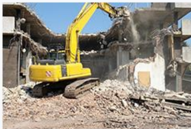
Wrecking & Demolition works